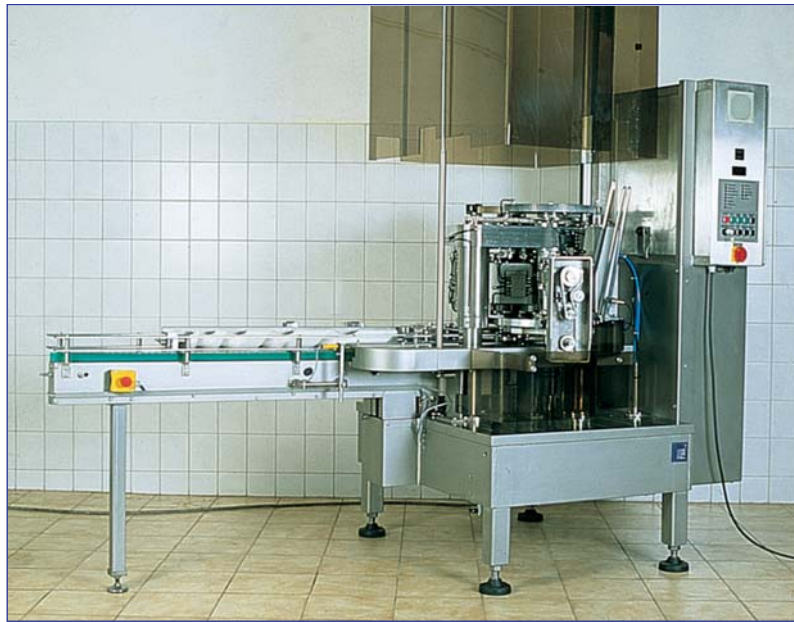
Maschine mit geöffneter Sicherheitshaube