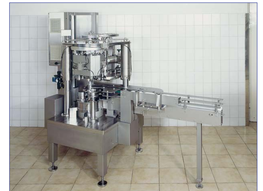
Maschine von der Einrichterseite

• Eine Synchronisation mit einem beliebig vorgeschalteten Rundläufer ist mit unserem Verschleißautomaten jederzeit möglich.